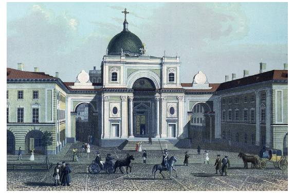
Церковь Святой Екатерины Александрийской

Несмотря на то, что певица уже давно и крепко связана с Россией и