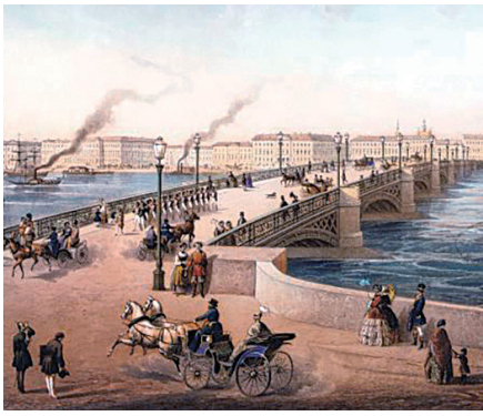
Благовещенский (Николаевский) мост, 1910-1914гг.

«Любимая прогулка теперь – Благовещенский мост, драгоценное ожерелье красавицы Невы, верх искусства во всех отношениях! Мост прельщает в двойном виде. Днем он кажется прозрачным, будто филиграновый, легкий как волны, а при полном освещении является громадною массою, спаивающую между собою два города...»